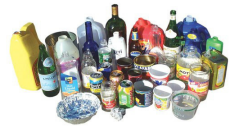
可回收物品 (塑料、金属、玻璃、铝箔纸)