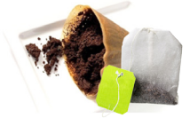
咖啡渣、咖啡过滤纸和茶叶包