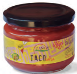
Salsa Taco 200 g