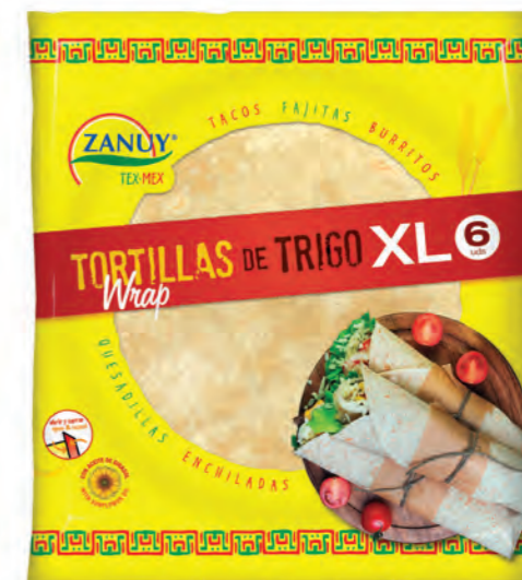
Tortillas Wraps XL 375 g