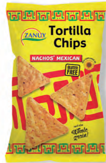
Tortilla Chips Mexican 200 g