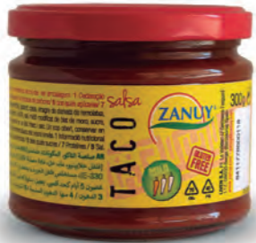
Salsa Taco 300 g