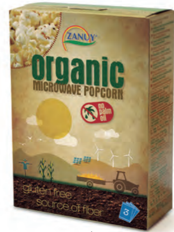
Palomitas de Microondas Ecológico 225 g