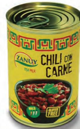
Chilli con carne 415 g