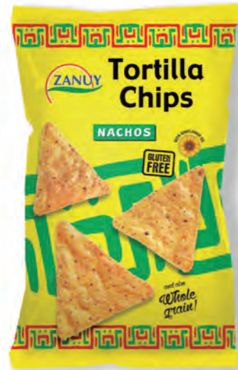
Tortilla Chips Natural 200 g 454 g*