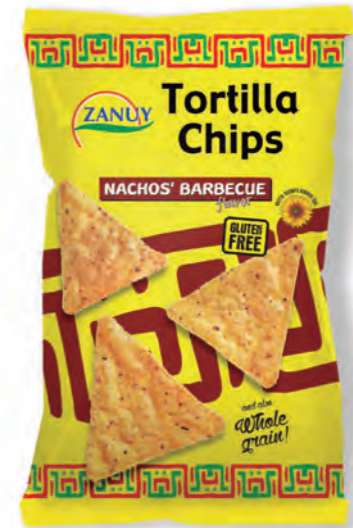
Tortilla Chips Barbacoa 200 g