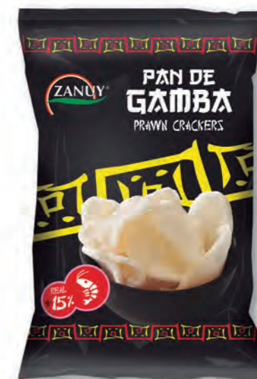
Pan de Gamba 50 g

Nuestro Pan de Gamba Zanuy es tu elección. Este snack es ideal para consumir sólo o también como acompañamiento. ¡Siempre con un sabor exótico del que no te arrepentirás!