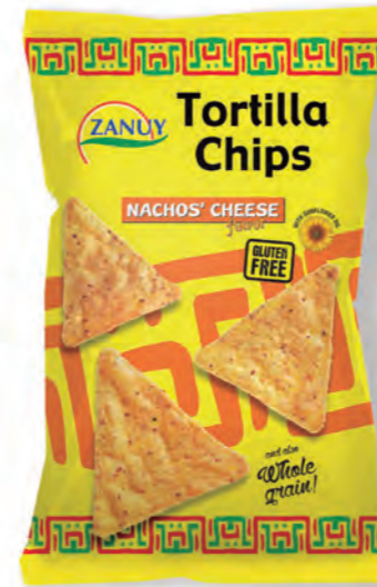
Tortilla Chips Queso 200 g