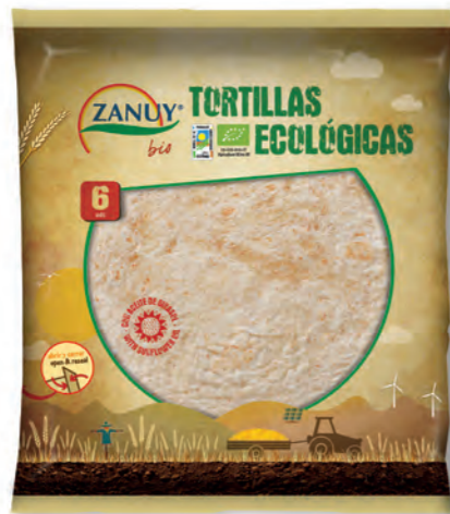
Tortillas Ecológico 240 g