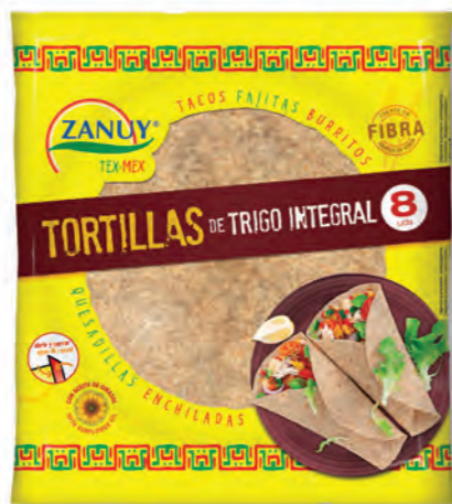
Tortillas Trigo Integral 320 g