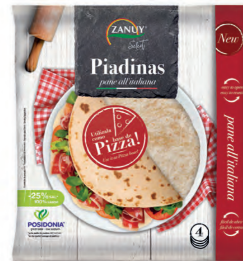
Piadina 320 g