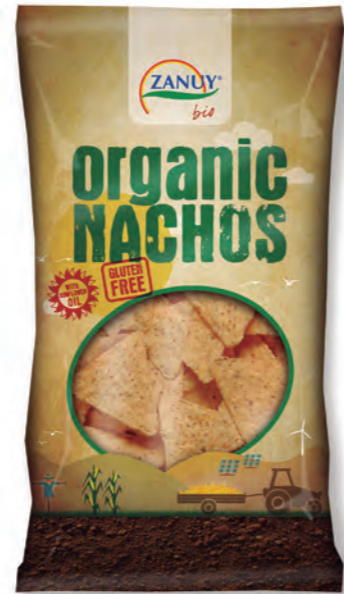
Tortilla Chips Ecológico 125 g