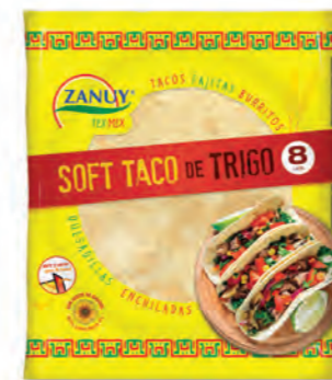
Soft Taco 175 g