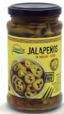
Jalapeños en rodajas 225 g