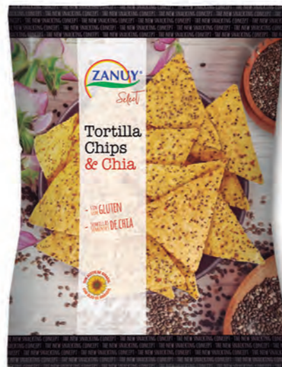
Tortilla Chips & Chía 130 g 454 g