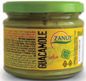
Salsa Guacamole 300 g