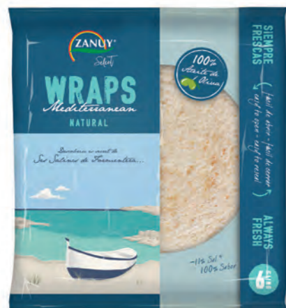
Wraps Mediterranean Natural 240 g