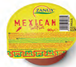
Salsa Mexican 90 g