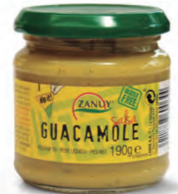
Salsa Guacamole 190 g