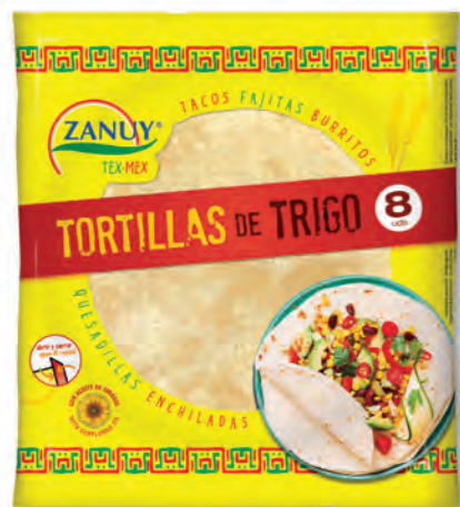
Tortillas Trigo 320 g