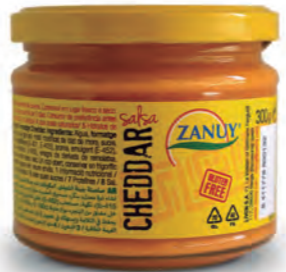
Salsa Queso Cheddar 300 g