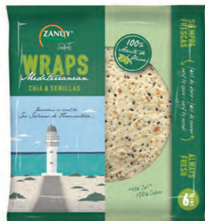
Wraps Mediterranean Chia & Semillas 240 g