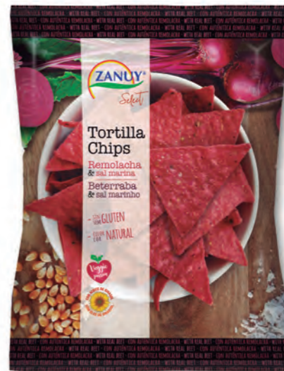
Tortilla Chips Remolacha & Sal Marina 130 g