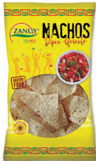
Tortilla Chips Dipping Blanca 150 g