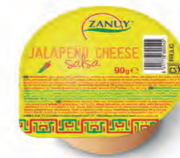
Salsa Jalapeño Queso 90 g