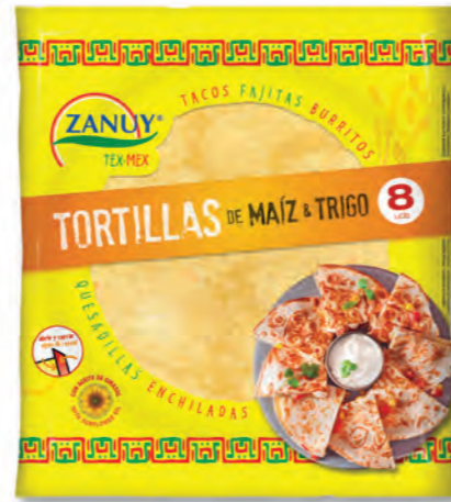
Tortillas de Maíz 320 g