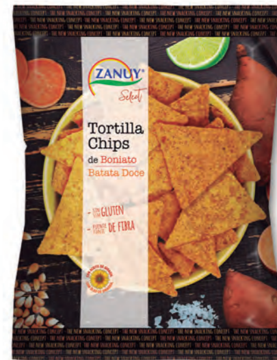
Tortilla Chips Boniato 130 g