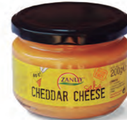
Salsa Queso Cheddar 200 g