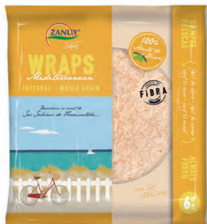
Wraps Mediterranean Integral 240 g