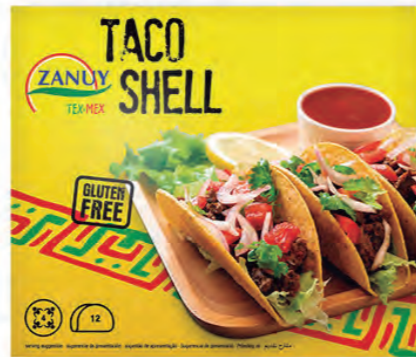
Taco Shell 150 g