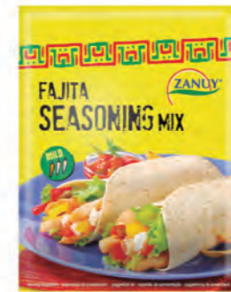
Fajita Sazonador Mix 35 g