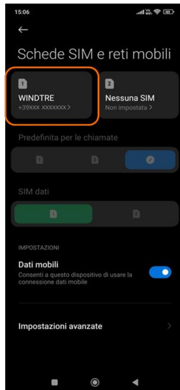
2. SIM WINDTRE