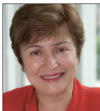
KRISTALINA GEORGIEVA 世行副行长兼秘书长