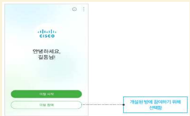
미팅 번호 또는 미팅방URL을 통해 입장