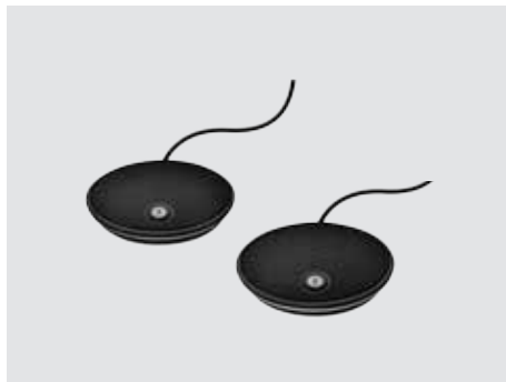
MICROFONI DI ESPANSIONE

Un sistema per videoconferenze straordinariamente economico per ambienti medio-grandi, in grado di trasformare qualunque sala riunioni in uno spazio di collaborazione video.