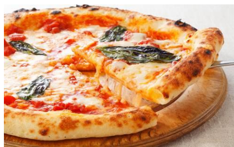
【『富久 Café』 および出来立てピザの商品イメージ】