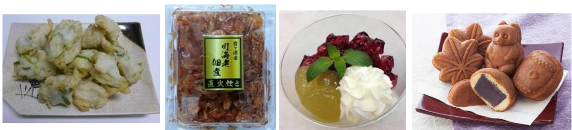
【主な商品の一例 イメージ】