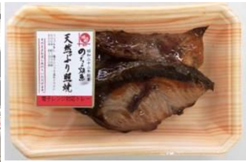
【「のざきの焼き魚」 イメージ】