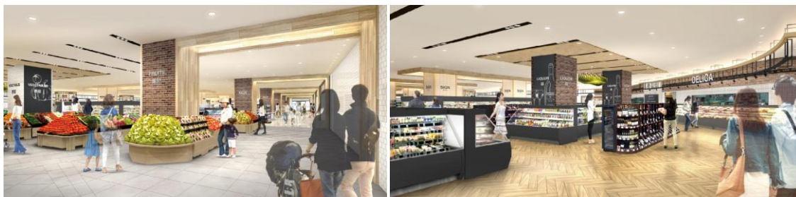
【『食品館新宿富久店』店内イメージ】

『食品館新宿富久店』は、イトーヨーカドー都市型スーパー事業の第9号店で、当社初の東京・新宿エリアへの出店となります。当事業最大の生鮮売場を設置し、「鮮度」「品質」「味」にこだわった、産地直送の新鮮野菜や果実、近海魚を豊富に取りそろえるほか、対面での接客販売を強化いたします。さらに出来立て、作りたての惣菜のほか、ドレッシングやお菓子等、食品館初のオリジナル商品 30 品目を販売し、地域のお客様に日々親しんでいただける地域一番店を目指し、努めてまいります。