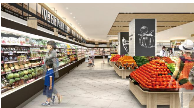
【青果売場 イメージ】

さらに、お客様の健康志向に対応した“オーガニックコーナー”を導入。頻度性の高いカテゴリーを中心とし、有機野菜を常時約30品目品揃えいたします。また、オーガニック加工食品（ドレッシング、飲料等）も併売することにより、お客様に新たな食シーンをご提案