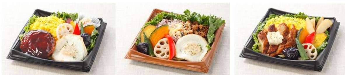
【「カフェプレート」商品イメージ】

「富久 Café」では、お客様に美味しくおしゃれに昼食をお召し上がりいただけるよう、新たに 8 種類の「カフェプレート弁当」の売場を併設し、日替わりでご提供をいたします。照りたまハンバーグ等の人気メニューから、ガパオやケイジャンチキン等の話題メニューまで、彩りよく盛付した商品となります。また、近隣にオフィス等の立地与件もあることから、毎日の昼食に飽きないよう、税込 500 円の「日替わり弁当」（平日限定）もご提供してまいります。