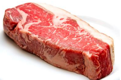
【ドライエージングビーフ イメージ】