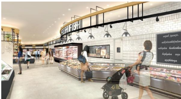
【鮮魚売場 イメージ】

また、お客様ニーズの高い、お手軽に食すことのできる簡便商材にて、金沢近江町市場の人気老舗「のざきの焼き魚」10品目を販売、さば・ぶり等の素材を、手間暇かけた工程で味を追求した商品をご提供