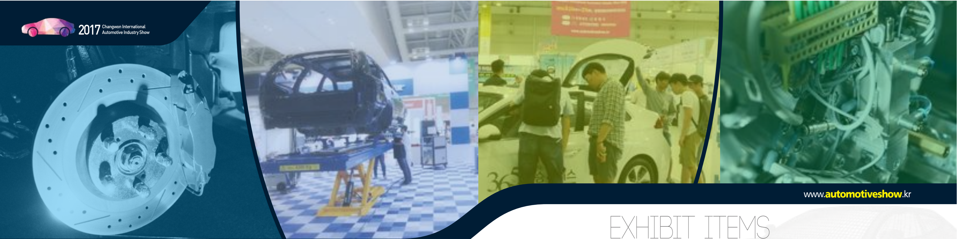
EXHIBIT ITEMS CONCURRENT PROGRAMS