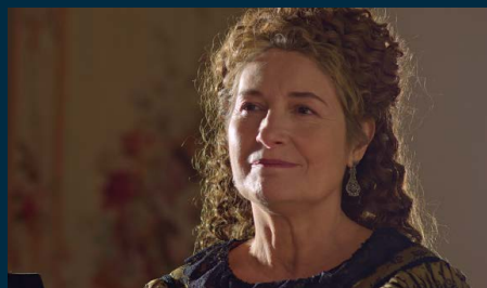
ASSUMPTA SERNA Condesa Corbos