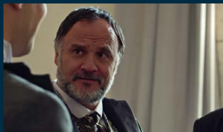
CARLOS CAÑAS Conde de Corbos