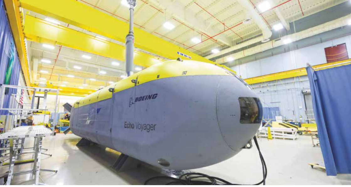
Unbemannte Zukunft: Das 17 Meter lange, autonome U-Boot „Echo Voyager“ war 2016 der Prototyp für das Large Unmanned Underwater Vehicle „Orca“ der US Navy heute