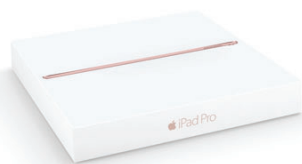
9.7インチiPad Proの小売用パッケージでは、再生素材を最低38パーセント使用しています。

Appleは、非常に効率の良い設計とリサイクル効率の高い材料の使用により、製品寿命の終了時に発生する材料廃棄物を最小限に減らしています。さらにAppleは、自社製品を販売する国の99パーセントでリサイクルプログラムを実施するか、プログラムに参加しています。これらのプログラムの利用方法については、 www.apple.com/jp/recycling をご覧ください。