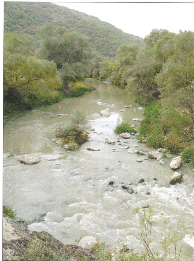
Сл. 5. Црна Река на влез во Скочивирската Клисура

Цулеска Река , се наоѓа на планината Бистра, јужно од селото Лешница и северозападно од Кичево.