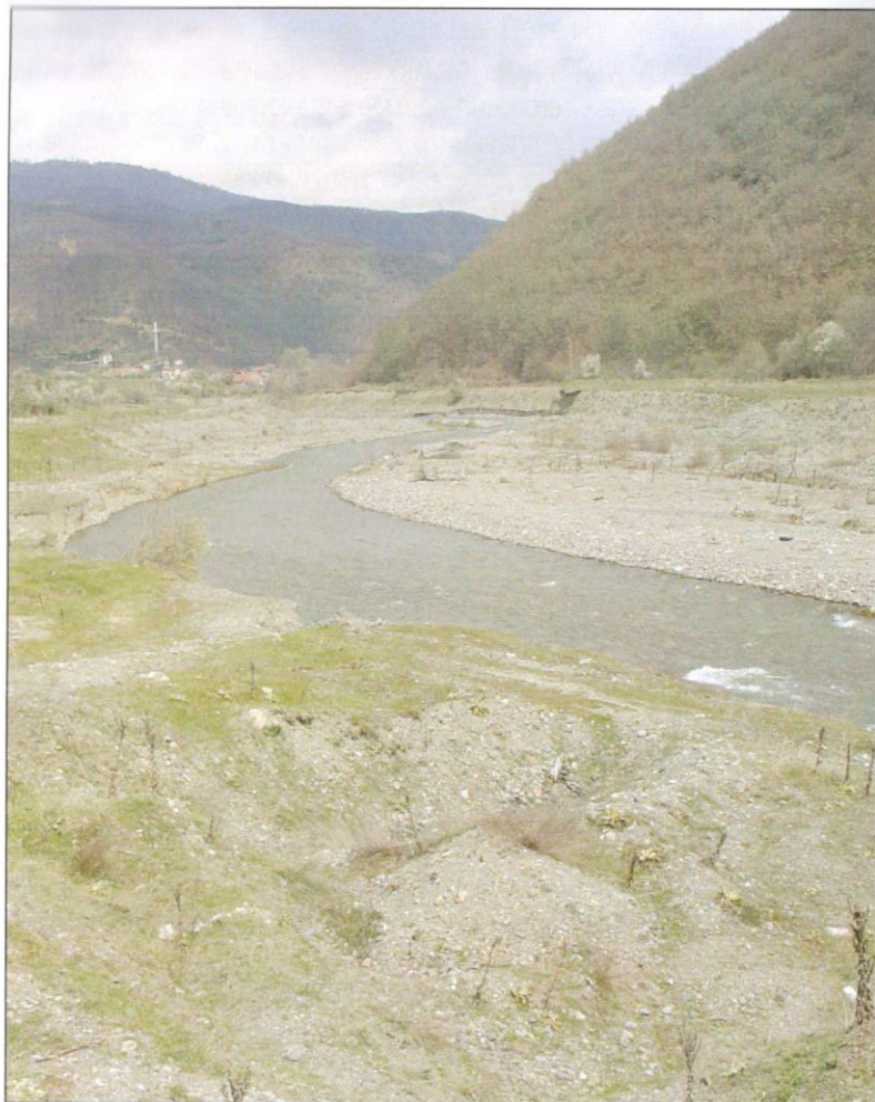
Сл. 3. Река Сатеска во областа Дебарца

Селишка Река , се наоѓа на северниот дел од Плакенска Планина, североисточно од Охрид. Извира јужно од селото Брежани, поминува низ раселеното село Селиште и селото Брежани и се влива во Голема Река (Дебарцка).