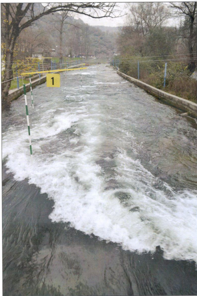
Сл. 4. Река Треска кај локалитетот Матка со патеката за кајак на диви води

Турија , река во Струмичко Поле, јужно од селото Сарај и североисточно од Струмица. Зафаќа сливно подрачје од 280,2 km 2 .