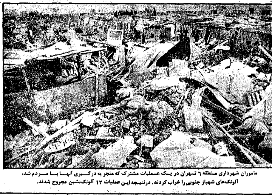
مأموران شهرداری منطقه ۶ تهران در یک عملیات مشترک که منجر به درگیری آنها با سرودم شد، آلودگی های شهاب جنوبی را خراب کردند. در نتیجه این عملیات ۱۳ آلودگنشین منجمد شدند.

از نیمه شب فردا: ساعتها، یکساعت عقب کشیده میشود ساعت رسمی کشور از فردا - جمعه - سیزدهم مردادماه، یکساعت به عقب کشیده می شود. نیمه شب جمعه ساعت رسمی کشور تغییر می کند و هنگامیکه عقربه های ساعت یک باره از نشان میروند، رادیو ایران به جای ساعت یک با صدای ساعت ۲۴ را اعلام خواهد کرد. صفحه ۵ - ستون هشتم