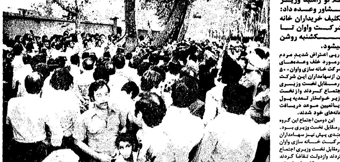
۵۰۰ خریدار شرکت خانه‌سازی واوان که بلا تکلیف ماندند، برای دومین بار در نخستین و دومین اجتماع شرکت کردند و خواستند یا به آنها خانه بدهند، یا پولشان را برگردانند.

این دومین اجتماع این گروه در مقابل نخست و پیری بود. چندین نفر سهامداران شرکت خانه سازی واوان در مقابل نخست وزیر اجتماع کردند و از دولت تقاضا کردند که در صورت عدم پرداخت پولشان را برگرداند. در این اجتماع که در روز پنجشنبه برگزار شد، شرکت کنندگان خواستار تسویه حساب و بازگرداندن پولشان را کردند. در این اجتماع که در روز پنجشنبه برگزار شد، شرکت کنندگان خواستار تسویه حساب و بازگرداندن پولشان را کردند.