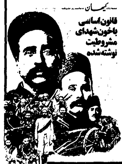
قانون اساسی با خون شهدای مشروطیت نوشته شده

● بیانیه گروه بررسی مسائل ایران: انقلاب مشروطیت نشان دهنده دلنستگی ملت ایران به حکومت قانون است. صفحه ۲ - ستون چهارم