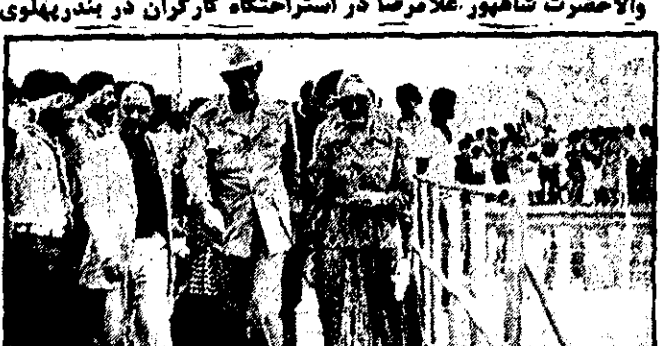
والاحضر شاهپور غلامرضا پهلوی ریاست شورای عالی ورزش کسارگران دیروز به استاسف