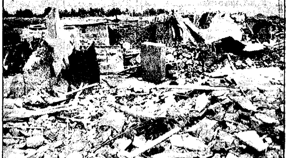
ماموران منطقه ۶ شهرداری، دیروز با کمک گرفتن از نیروهای دیگری، در یک عملیات مشترک آلونک‌های شهباز جنوبی را خراب کردند. در نتیجه این عملیات گسترده که منجر به درگیری مردم با مأموران شد ۱۳ نفر مجروح شدند.