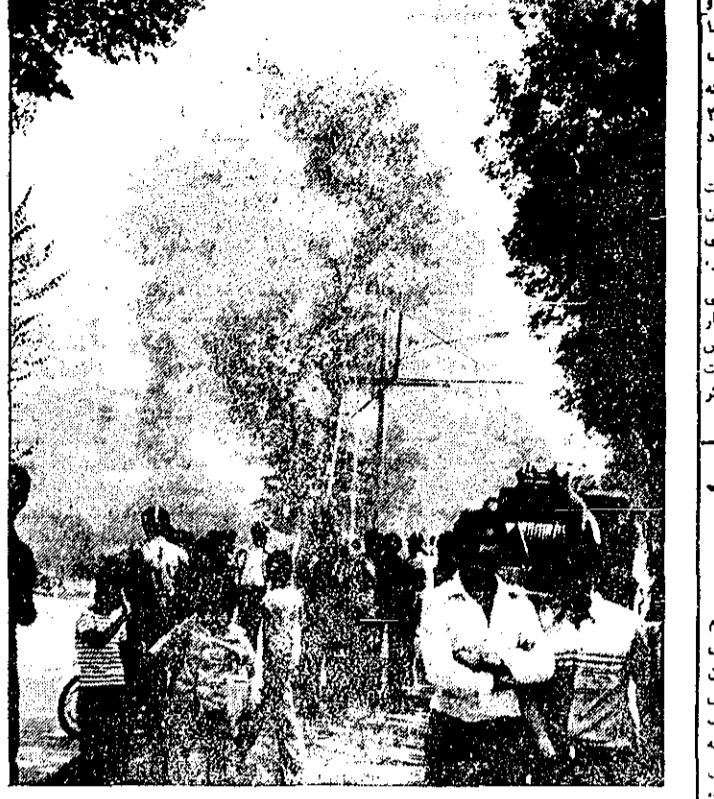
صحنه‌ای از عملیات اطفای حریق