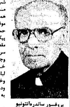
پروفسور ساندرو آنتونیو

شب هنگامیکه پس از انجام مراسم مذهبی در کلیسای ممدان عازم کرمانشاه بود چون موفق به پیدا کردن موبوسی حمل و نقل عمومی نشد با یک پیکان سرهای رنگ از ممدان به مقصد کرمانشاه برآه افتاد ولی سر نشانی سوار در نرسه راه، وجه نقد، ساعت، عینک، خود کار و چندین اشیا حیاتی لباسهای مخصوص ویرا زدیده و خود وی را مسجوع کرده و در نزدیکی کرمانشاه از اتومبیل به خارج پرتاب کردند. پروفسور آنتونیو در شکایتی که به مقامات متعلقه کرد نوشت: استدعا دارم طبق موازین قانونی کشور شهادت‌های ایران که در جریان حمله به کشیش کاتولیک، نماینده واتیکان در کلیسای غرب ایران به قرار گرفته و سبب دستگیری ایتالیا و واتیکان اطلاع داده و تحویل عدالت گردند. و از آنچه که اینجانب نماینده واتیکان پروفسور ساندرو آنتونیو ۶۶ ساله سرپرست کلیسای باطالع سفارت‌های دو کشور کرمانشاه ممدان و سنندج روز نهم گذشته ساعت ۹ و ۹ نیمه دنیال خود.