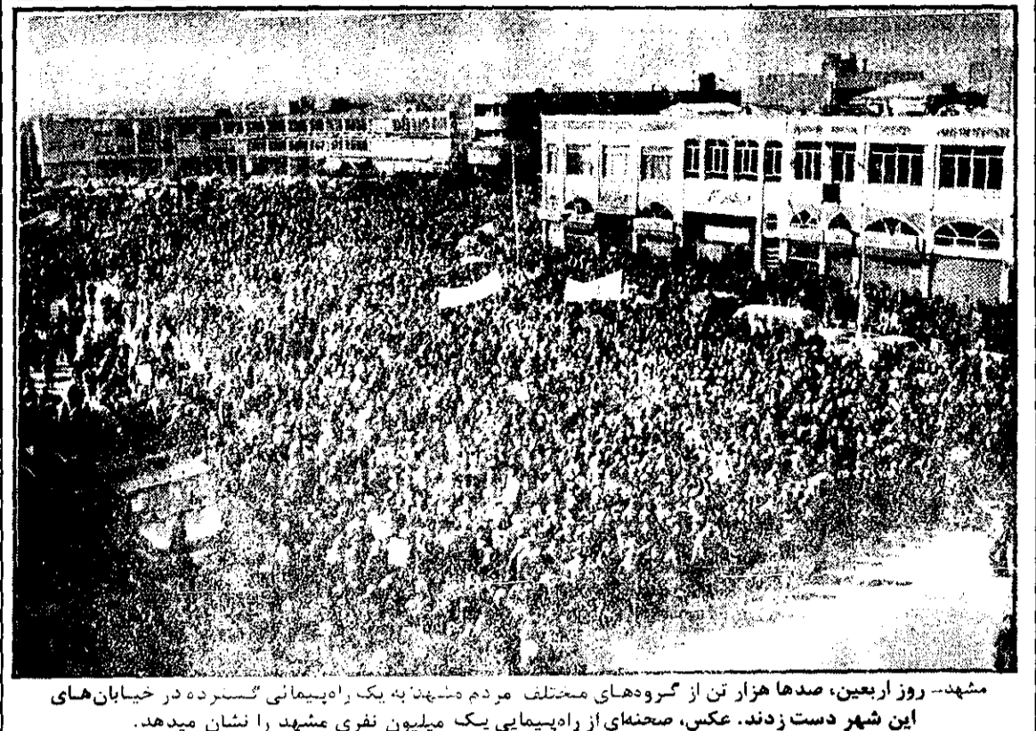
مشهد - روز اربعین، صدها هزار تن از گروه‌های مختلف مردم مشهد به یک راهپیمایی گسترده در خیابان‌های این شهر دست زدند. عکس، صحنه‌ای از راهپیمایی یک میلیون نفری مشهد را نشان میدهد.

پاریس - روزنامه «پاریس» - آیت‌الله خمینی رهبر نیروی مومنان مذهبی ایران روز جمعه در تهران نماز می‌خواند. این خبر که از سوی یک خبرنگار پاریسی به یک مجله فرانسوی اعلام شده است. یکی از نزدیکان آیت‌الله خمینی گفت رهبر ۷۸ ساله شیخان ایران برای نماز صبح و عشاء در مسجد اصلی شهر روز جمعه وارد تهران می‌شود و سپس در پیشانی جمعیت در گورستان اصلی شهر (پشت‌بازار) خواهد رفت. آیت‌الله خمینی در طول ماههای گذشته از طرفداران خود خواست ارتش را تحریک نکند، بگفته طرفداران آیت‌الله خمینی از ارتش حمایت خود را از آیت‌الله ابراز داشته است. آیت‌الله خمینی پیروز پرویز خود یکبار دیگر مردم را دعوت به آرامش کرد و از طرفدارانش خواست با مأموران امنیتی همکاری کنند. آیت‌الله خمینی دولت شاهنشاهی را به غیر قانونی اعلام کرده است، اما تاکنون برچیده شدن حکومت وی را درخواست نگرفته است. طرفداران آیت‌الله خمینی میگویند سربازان عقیدتمند که بعد از ورود آیت‌الله به ایران دولت را برکنار خواهند کرد. آیت‌الله خمینی اعلام کرد که یک دولت موقت اعلام خواهد کرد تا با شورای انقلاب اسلامی که آن نیز هنوز تعیین نشده همکاری کند و راه را برای ترتیب دادن انتخابات تحت یک قانون اساسی اسلامی هموار خواهد ساخت.