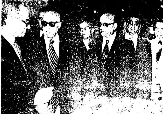
شاهنشاه آریامهر در روز ششمین سالگرد زلزله طبس به همراه وزیر امور اقتصادی و دارایی، دکتر جعفر شریفی‌امامی نخست‌وزیر نیز در این بازدید افتخار حضور دارد. (صفحه آخر ۳۲)

* به فرمان شاهنشاه آریامهر کمکهای ارتش به زلزله زدگان ادامه می یابد صفحه ۲