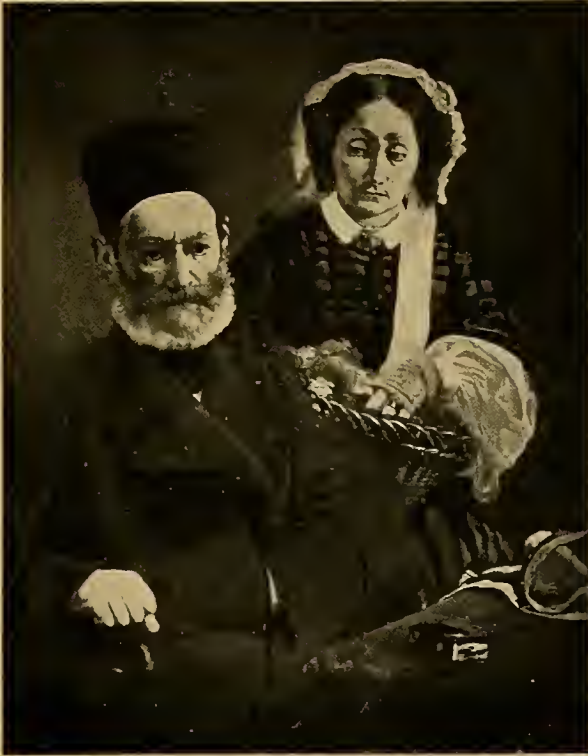
Die Eltern des Künstlers 1860.

Inhalts gewesen und nicht, wie man glauben sollte, Landschaften. Noch Courbet setzte seine im Atelier modellierten Figuren einfach ins Freie. Der konsequente Naturalismus musste sich dieses Widerspruchs bald klar werden und nach dessen Auflösung streben. Die bei der Darstellung des