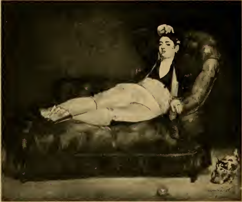
Dame als Torero costümiert 1863.

kennt. Selbst Courbet transponiert die Landschaft in die Farbenanschauung des Ateliers. Jetzt verändert sich mit einem Schlag das Ansehen der Bilder. Es ist, als wäre in die Atelierwand ein Loch geschlagen, durch das man plötzlich ins Freie sieht. Das verpönte Grün zieht in die Landschaftsmalerei ein. Man malt ganz helle Bilder, in denen