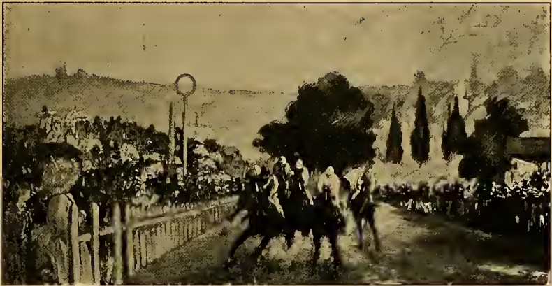
Rennen in Longchamps 1871.

besonderen künstlerischen Qualitäten Manets. Die Komposition ist so knapp und geschlossen als nur möglich, mit dem geringsten Aufwand an Mitteln ist die räumliche Situation klar gestellt, nichts ist da, das für die Bildwirkung gleichgültig oder nebensächlich wäre. Mag der Ausdruck der Dame etwas puppenhaft Starres haben, das übrigens porträtmässig gewesen sein soll — das Inkarnat ist ebenso frisch wie ihr Körper von weicher Schmiegsamkeit —, um so lebendiger in Haltung und Mienenspiel ist der über die Gartenbank gebeugte Mann. Dem Geschmack in der Anordnung ebenbürtig