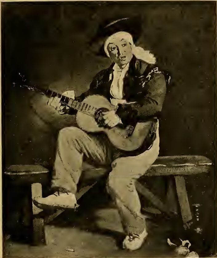
Der Guitarrero 1860.

und dass das Auge zwei Winkel hat. Er sieht noch nicht, dass die eine Schulter hinter der anderen und der innere Augenwinkel hinter der Wölbung des Augapfels verschwindet. Noch die Trecentomalerei umgrenzt alle Seiten eines Würfels