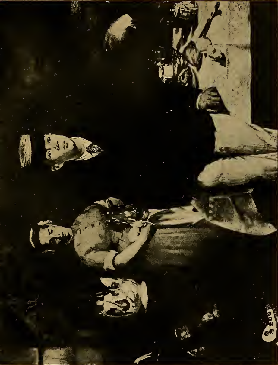
Frühstück im Atelier 1869.