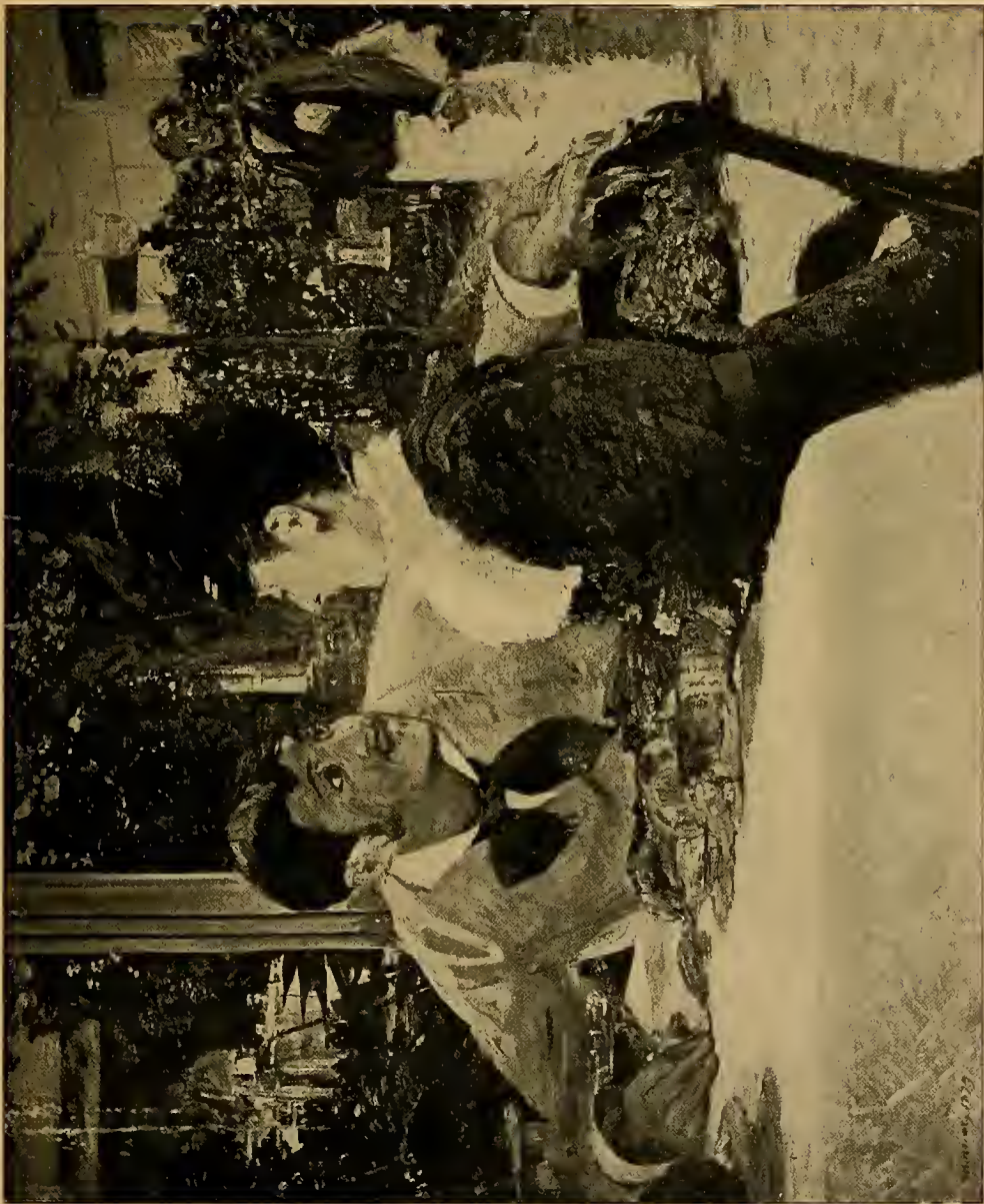
Bei Vater Lathuille 1879.