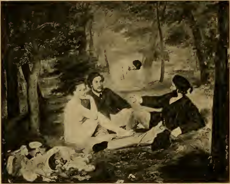
Frühstück im Grase 1863.

verstärkt und verlängert worden sein mochte. Er begegnete ihr schon mit seinen frühesten Werken. Denn Manet ist nicht nur nicht der erste gewesen, der sich mit den Problemen des Freilichts trug, sie haben ihn in seinen Anfängen noch gar nicht beschäftigt. Freilich war er durch seinen klaren Blick, durch das Programm seiner Jugend „zu malen, was ich sehe, und nicht was anderen zu sehen beliebt“ in