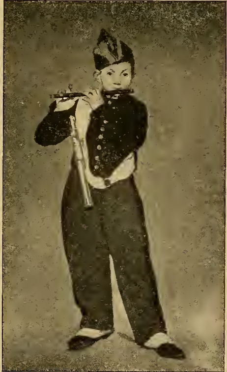
Der Pfeifer 1866.

oder Danaë bei Giorgione, Correggio und Tizian, an die Venus mit dem Spiegel von Velazquez und die sogenannte Danaë Rembrandts, endlich an Goyas nackte Maja. Dennoch glaubte Publikum und Kritik, als das Bild 1865 auf dem Salon erschien, vor etwas Unerhörtem zu stehen. Man sah nur die Nacktheit eines nicht eben schönen Modells, man lachte über