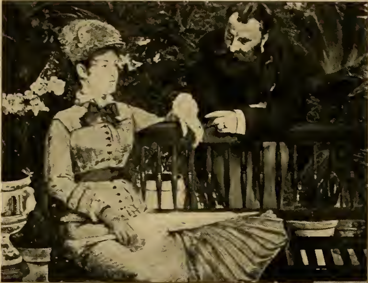
Im Treibhaus 1879.

Nach der Serre folgten noch ein paar grosse Bilder, wie der Löwenjäger Pertuiset und »Chez le père Lathuille«. Das erstere, als Porträt sehr lebendig und von grossen malerischen Schönheiten, hat doch in der posierenden Art, wie der kühne Nimrod mit gespanntem Gewehr neben einem zur Strecke gebrachten Löwen auf der Lauer liegt und der willkürlichen Landschaft etwas Erzwungenes, das Manet sonst fremd ist.