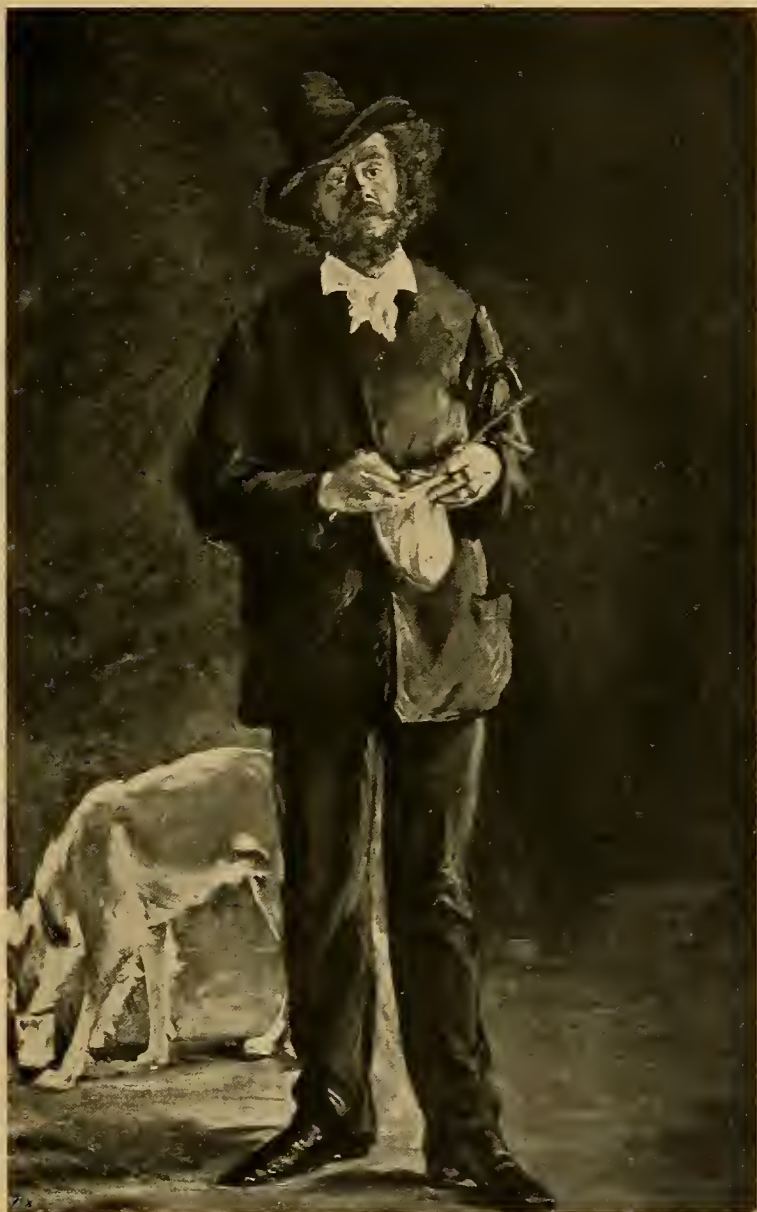
Portrait von Desboutin 1875.