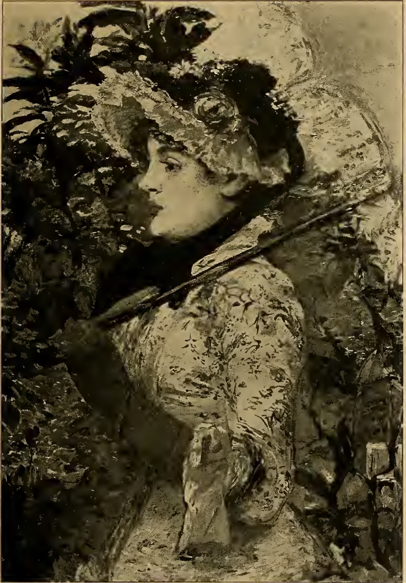
Der Frühling 1881.