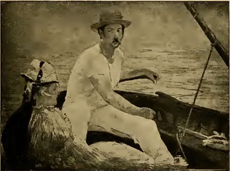
Im Segelschiff; um 1873.

Dem »Père Lathuille« an malerischen Qualitäten verwandt und ebenbürtig sind zwei kleinere, ebenfalls seinen letzten Jahren angehörende Strassenbilder. Beide geben nahezu die-