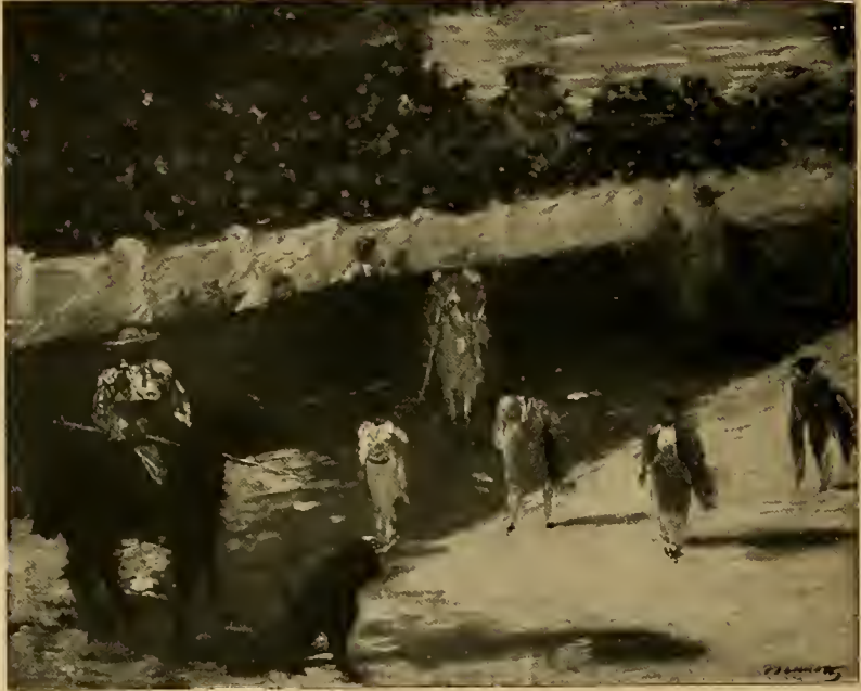
Stiergefecht; um 1880.

gegossen sich mit dem linken Arm auf den Polstersitz stützt und die Rechte mit dem Fächer über die Seitenlehne streckt, wird an ungezwungener Eleganz der Haltung und künstlerischem Geschmack der Anordnung in der ganzen modernen Malerei nicht übertroffen. In seinen allerletzten Jahren wollte Manet die vier Jahreszeiten in den Bildnissen eleganter Pariserinnen verkörpern. Er kam nicht über den Herbst, das Porträt