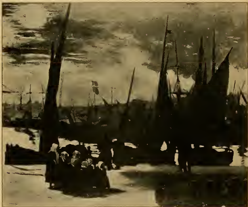
Hafen von Boulogne 1871.

diese ausserordentliche Naturfrische und Wahrheit seiner koloristischen Wirkung, die für Augen, die an die gedämpfte Farbigkeit älterer Bilder gewöhnt sind, zunächst etwas Erschreckendes hat. Eine weitere Folge dieser Sicherheit in dem Erfassen feinsten Tonunterschiede ist die eminente Stofflichkeit seiner Schilderung. So sichtbar jeder Pinselstrich dasteht, so wirkt die Farbe doch nie materiell, nie