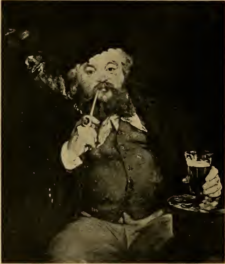
Am Biertisch 1873.

Diese bisher genannten und eine Reihe ähnlicher Bilder wie »Le Linge«, »Le Chemin de fer«, mit Figuren, deren weich beschattetes Fleisch dunkel gegen den hellen Himmel