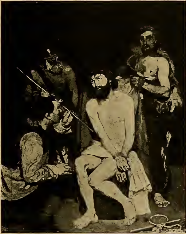
Ecce homo 1865.

Den Einfluss zu verfolgen, den der grosse Spanier auf die moderne Malerei gehabt, wäre eine lehrreiche Aufgabe. Viele der bedeutendsten Talente haben mit seinem fürstlichen Erbe gewirtschaftet, Manet hat es vermehrt. Er hat ihn nicht in Äusserlichkeiten, sondern im Geiste nachgeahmt.