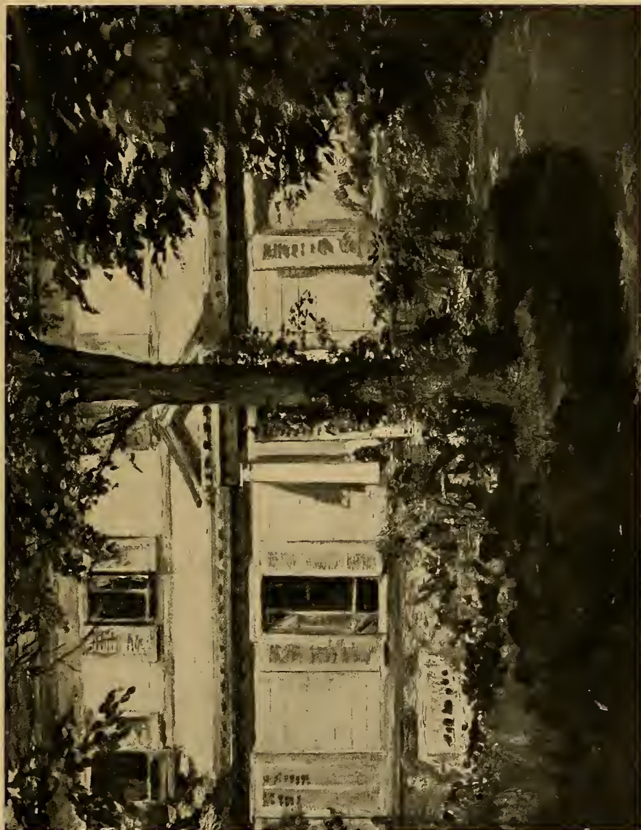
Landhaus in Rueil; um 1880.