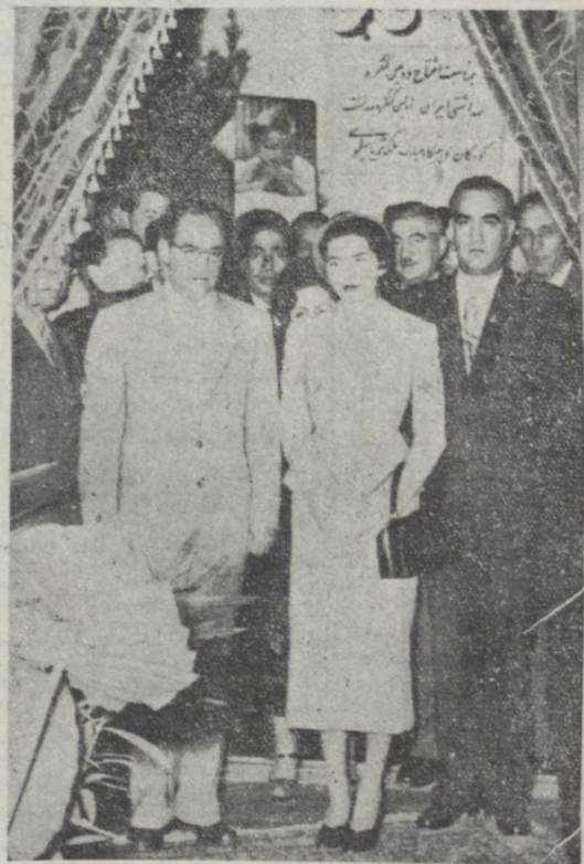
علیا حضرت ملکه ثریا ضمن بازدید مستهای مختلف کنگره پزشکی رامسر دیده میشوند. آقایان دکتر صالح وزیر بهاری و دکتر اقبال نیز حضور دارند

اگر این جوان بی‌سواد ۱۰ سال تحصیل دهد در کارها خدای نکرده تمیز میشود مثلا فرزند فلان وزیر یا وکیل و منتفک که در ایام تحصیل اسلاب کسب فضیلت نموده صرفاً با نگاه پارتی در مدارس فلان شغل حساس قرار گرفته اما او با آنکه در تمام ادوار تحصیلی مرتباً تحصیل و رفتارش مورد رضایت کامل اولیاء مدرسه بوده ولی پس از فراغت از تحصیل امروز در درجه کم‌میزنه او را مانند توب قوتیال باین طرف و آن طرف برناب مینمایند و هیچکس بفکر آن نیست که از وجودش برای این اجتماع استفاده نماید گذشته از آنکه مایوس میشود و این پاس در دروسه خانوادگی او اثری بسیار ناگوار باقی میکند و اداسی او را آماده قبول هزاردان مفساد و سقوط خواهد شد. بقیه در صفحه یازدهم