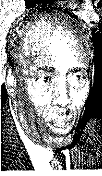
زیادباز، رئیس جمهوری سومالی - مواجه با ناراضی ارتش

مکادشو - خبرگزاری فرانسه - محمد زیادباز، رئیس جمهوری سومالی اعلام کرد که پرسنل، توسط کودتایی توسط عده ای افسرو سرباز در کشور صورت گرفت که به پایمردی سربازان ارتش سوزنی خونی شد. زوال باره که این خبر در بیابانهای جنوبی به ملت از طریق رادیو، فاش کرد همچنین گفت که برخی از سربازان بیگانه و بعضی از قدرتمند خارجی در این توطئه دست داشته و برای از میان بردن ملت و وحدت سوماتی توطئه می کردند. زیادباز همت این مأموران و قدرتمند خارجی را فاش نکرد، اما پس از انکوش از این بیگانهان این نیروهای خارجی، از صلت خواست هوشیار باشد و متحد بماند. زوال زیادباز همچنین اعلام کرد که همه مسلمانان توسط کودتادرسو شکست خوردند و توجیل عدالت خواهند شد. خبر توطئه کودتای سومالی را نخستین بار خبرگزاری سوئد از مگادشو گزارش داد و اعلام کرد که زوال زیادباز ضمن انتشار این خبر گفته است که کنترل اوضاع را کاملاً در دست دارد هر چند که چهار افسر و عده ای سرباز بنا بر خبرگزاری از کمک قدرتمند خارجی، مستأجر و امیرالیست در توطئه شرکت کرده بودند. رئیس جمهوری سومالی درباره جزئیات توطئه توضیحی نداد اما خبرگزاری سوئد گزارش کرد که در این واقعه عده بسیاری از رهبران سومالی کشته شدند. خبرگزاری سوئد در گزارش دیگری اعلام کرد که زره پوشان و سربازان بیگانه ای که توطئه را سرنگ کردند، در توطئه شرکت کرده بودند. رئیس جمهوری سومالی درباره جزئیات توطئه توضیحی نداد اما خبرگزاری سوئد گزارش کرد که در این واقعه عده بسیاری از رهبران سومالی کشته شدند. خبرگزاری سوئد در گزارش دیگری اعلام کرد که زره پوشان و سربازان بیگانه ای که توطئه را سرنگ کردند، در توطئه شرکت کرده بودند.