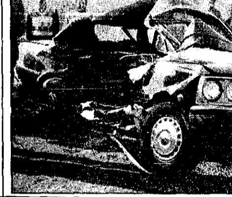
محتمای از تصادف

در این حادثه راننده اتومبیل سواری به سبب جرم تصادف در تصادف کشته شد و تصادف در خیابان باغچه به وقوع پیوسته است.