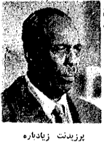
زادبارة رئیس جمهوری هومالی قهرتای خارجی به دست داشتن در کودتا متهم کرد.

عده زیادی از مأموران دولت و عاملان کودتا کشته شدند