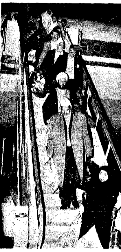
اولین گروه زائران سرگردان ایرانی ساعت ۶ و نیم صبح با هواپیمای به تهران بازگشتند

پانزدهم آذر ۲۸۴ زائر سرگردان ایرانی از دمشق به تهران بازگردانده شدند. این گروه از زائران سرگردان ایرانی که در جریان انقلاب سوریه از وطن خود دور شده بودند، در این باره به تبرئه شدند.