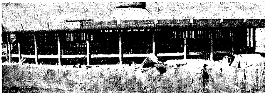
ایستگاه مرکزی اتوبوسهای مسافری، روز چهارم این افتتاحیه بود. ۹۰ درصد عملیات ساختمانی این ایستگاه در فرح آباد خزانه پایان یافته است و هفت ماه دیگر مورد استفاده قرار خواهد گرفت. این مرکز، در سال نو تشکیل داد.