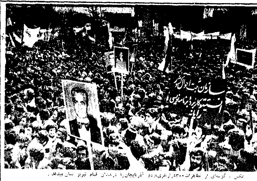
تجمع گویای از تظاهرات ۲۰۰ هزار نفری مردم آذربایجان در میدان قیام تبریز نشان میدهد.

اعلامیه دربار شاهنشاهی رئیس جمهوری آلمان فدرال به ایران می آید صفحه ۲۲ - ستون دهم