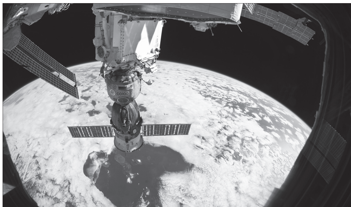
Космические технологии найдут применение и в самом космосе, и на Земле.

Возвращение на Землю уроженца Ставрополя Героя России Олега Скрипочки запланировано на 17 апреля. Об этом сообщил Роскосмос. Вместе с нашим земляком космическая вахта финиширует для астронавта NASA Эндрю Моргана и Джессики Меир. Конечно же, Международная космическая станция ни на один день не останется необитаемой. Заранее, 9 апреля, на орбиту на корабль «Союз МС-16» должен отправиться новый экипаж в составе российских космонавтов Анатолия Иваншина, Ивана Вагнера и астронавта NASA Кристофера Кэссиди. Экзаменационные комплексные тренировки основного и дублирующего составов экспедиции МКС-63 уже успешно завершились.