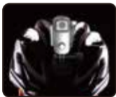
Ездить на велосипеде