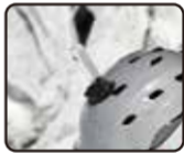
катание на лыжах