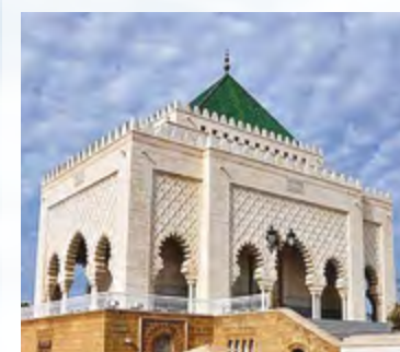
Mohammed V Mausoleum Mausolée Mohammed V