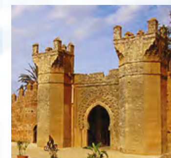
Chellah Necropolis Nécropole du Chellah