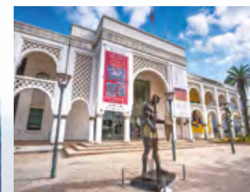
Mohammed VI Museum of Contemporary and Modern Art Musée Mohammed VI d'art moderne et contemporain