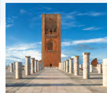
Hassan Tower Tour Hassan