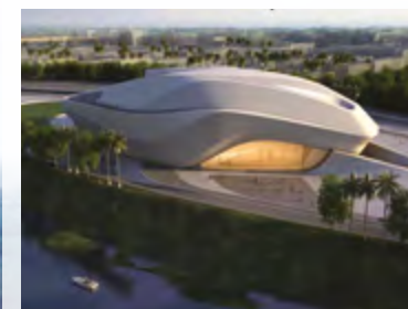
Rabat Grand Theater Grand Théâtre de Rabat