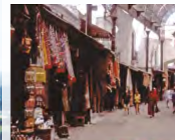
Consuls street Rue des consuls