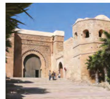
Kasbah of Oudayas Kasbah des Oudayas