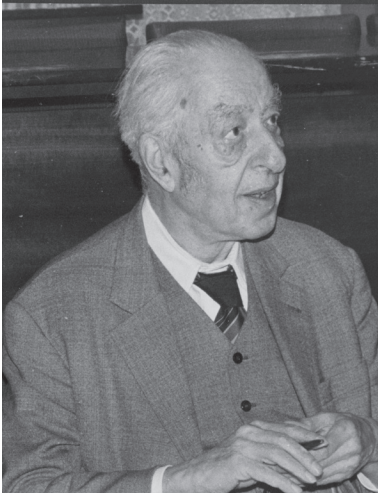
Abb. 5: Jürgen Kuczynski