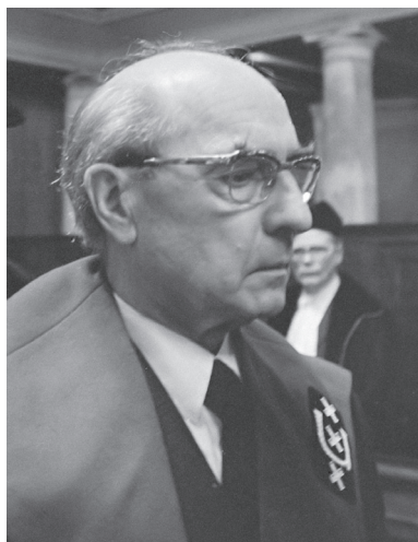
Abb. 9: Arthur Lehning