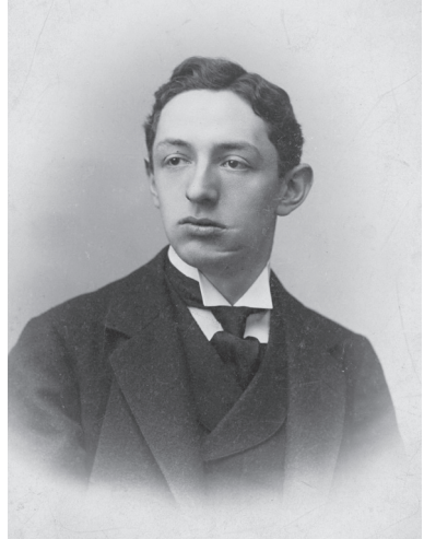
Abb. 6: Robert René Kuczynski