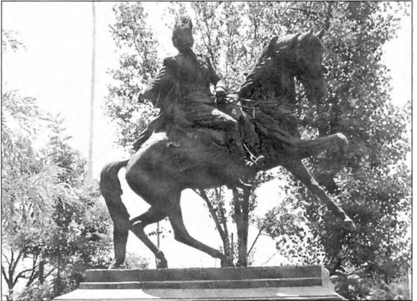
श्री ३ चन्द्र शमशेर (इ.सं. १८६३-१९२९)