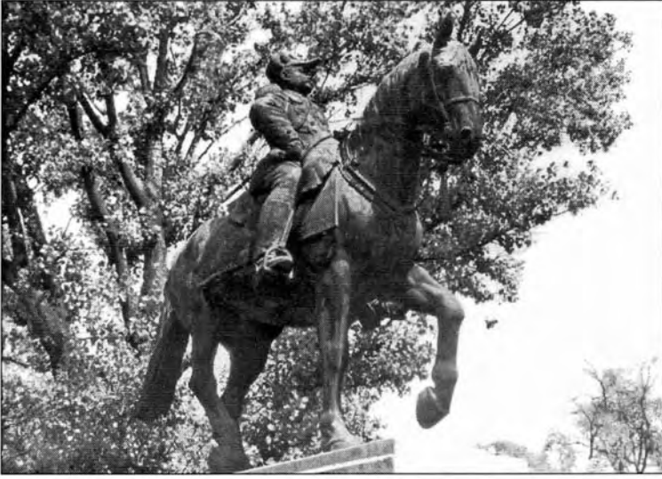
श्री जुद्ध शमशेर (इ.सं. १८७५-१९४५)