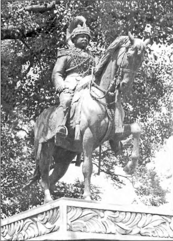
श्री ५ पृथ्वी वीर विक्रम शाह (इ.सं. १८७५-१९११)