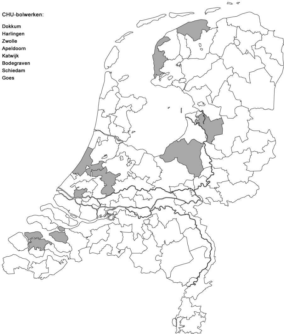
Kaart 6.1 De bolwerken van de CHU en haar voorlopers, 1901-1917.