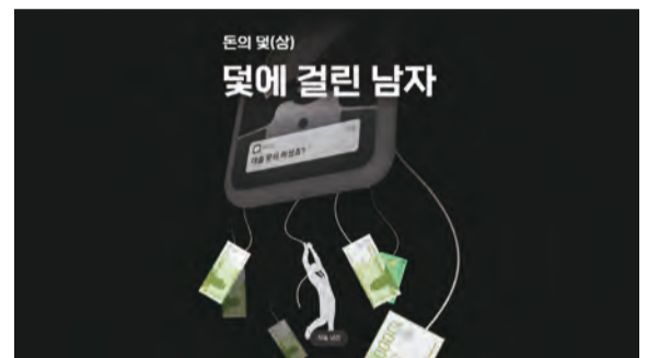
불법사채 조직에 몸담았던 김민우(가명·37) 씨의 육성 증언이 담긴 인터랙티브 기사

히어로콘텐츠 8기 팀장을 맡은 뒤 히어로콘텐츠 시즌2의 '시작'이라는 사실이 내내 부담이었다. '본편만 한 속편은 없다'는 말이 머릿속을 맴돌았다. 전작들이 보여준 탁월한 품질은 유지하면서도 전작들과 다른 콘텐츠를 제작하려면 소재부터 달라야 했다. 앞서 선보인 히어로콘텐츠들이 독자의 마음을 사로잡고 사회를 움직일 수 있던 건 스토리의 힘이 특히 컸다.