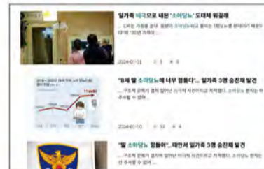
동아일보 취재팀의 소아당뇨 연속 보도

동아일보·동아사이언스, 한국과학기자협회 2024년 상반기 과학취재상 수상