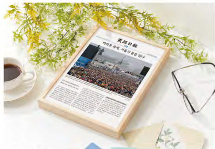
'마이 아티클' 액자 상품 이미지

지난해 LG트윈스가 29년 만에 프로야구 한국시리즈에서 우승하자 우승 소식을 알린 신문의 품귀 현상이 일어났다. 팬들이 우승 기사가 실린 신문을 '기념품'처럼 받아들이며 웃돈 거래까지 이뤄진 것이다.