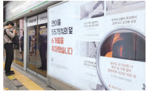
6월 24일부터 7월 23일까지 한 달간 서울 지하철 2호선 사당역 스크린도어에 게재된 '트랩' 홍보물.