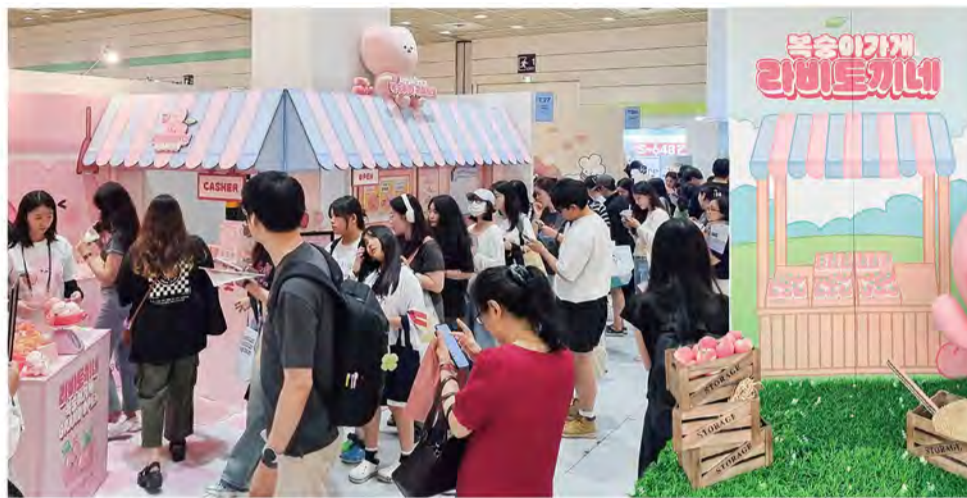
7월 4일부터 나흘간 열린 서울일러스트레이션페어에 마련된 라비 부스에 관객들의 발길이 이어졌다.

채널A는 이번 행사에 <금쪽같은 내 새끼>에서 어린이들의 마음을 열어주는 친구로 활약하고 있는 '금쪽이', <하트시그널>에서 태어나 사랑의 아이콘으로 자리매김한 '라비', <티처스>에서 열심히 공부하는 학생들의 페르소나로 활약 중인 '공부기'와 '독기' 등의 다채로운 캐릭터를 선보인다. 늦둥이 아버지의 육아 성장기를 담은 <아빠는 꽃종년>과 함께 새롭게 탄생한 곰 두