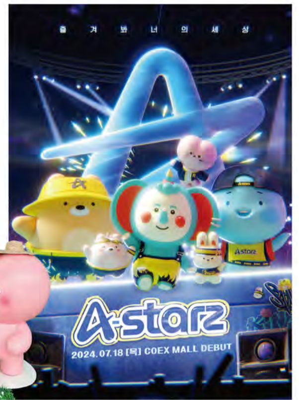
아이돌 그룹 'A-Starz'로 데뷔하는 채널A 대표 캐릭터들.