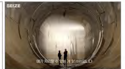
극한호우 공동취재팀이 취재한 부천의 빛줄 터널