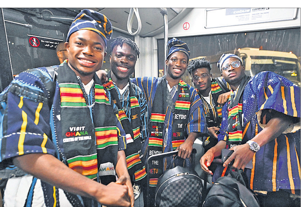
ଫିଫା ବିଶ୍ୱକପ୍ ପାଇଁ କାତାରରେ ପହଞ୍ଚିଥିବା ଗାନା ଦଳ।

ନୃତ୍ୟ ପରିବେଷଣ କରିବେ ନୋରା କାତାରରେ ଅନୁଷ୍ଠିତ ହେବାକୁ ଥିବା ବିଶ୍ୱକପ୍‌ର ଉଦ୍‌ଘାଟନା କାର୍ଯ୍ୟକ୍ରମରେ ନୃତ୍ୟ ପରିବେଷଣ କରିବେ ବଲିଉଡ୍ ଅଭିନେତ୍ରୀ ନୋରା ଫଡେହା। କଣେ ଆଲଫନ୍ ଡ୍ୟାନ୍ସର ଭାବରେ ନୋରା ପ୍ରସିଦ୍ଧ ହାସଲ କରିଛନ୍ତି। ବିଭିନ୍ନ ଭାରତୀୟ ଭାଷାରେ ୨୫ରୁ ଅଧିକ ଫିଲ୍ମରେ ଅଭିନୟ କରିଥିବା ନୋରା ମରଲୋର ନାଗରିକ। ୨୦୨୨ ବିଶ୍ୱକପ୍ ପାଇଁ ଫିଫା ଅଧିପିଆଳ ସିଙ୍ଗଲ ଲାଇଭ୍ ଦ ଖାଲ୍‌ରେ ସେ ନୃତ୍ୟ ପ୍ରଦର୍ଶନ କରିବେ। ଏହା ସହିତ ଉଦ୍‌ଘାଟନା ଉତ୍ସବ ପାଇଁ ସେ ରେଡ୍ ଖାଲ୍, ମାନାଲ୍, ବଲିକିସ୍ ଓ ରହମା ରେଡ୍‌ଙ୍କ ସହିତ କୋଲୋବରେସନ୍ କରିବେ ବୋଲି ଜଣାପଡିଛି।