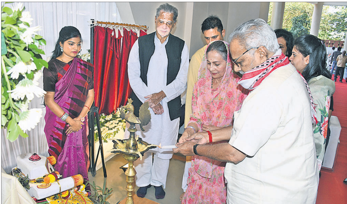
ରାଜ୍ୟପାଳ ପ୍ରଫେସର ଗଣେଶ ଲାଲ ପ୍ରଦୀପ ପ୍ରଜ୍ଜ୍ୱଳନ କରି ‘ଏକାଗ୍ର ବାଟିକା’ ସ୍କୁଲକୁ ଉଦ୍ଘାଟନ କରୁଛନ୍ତି।