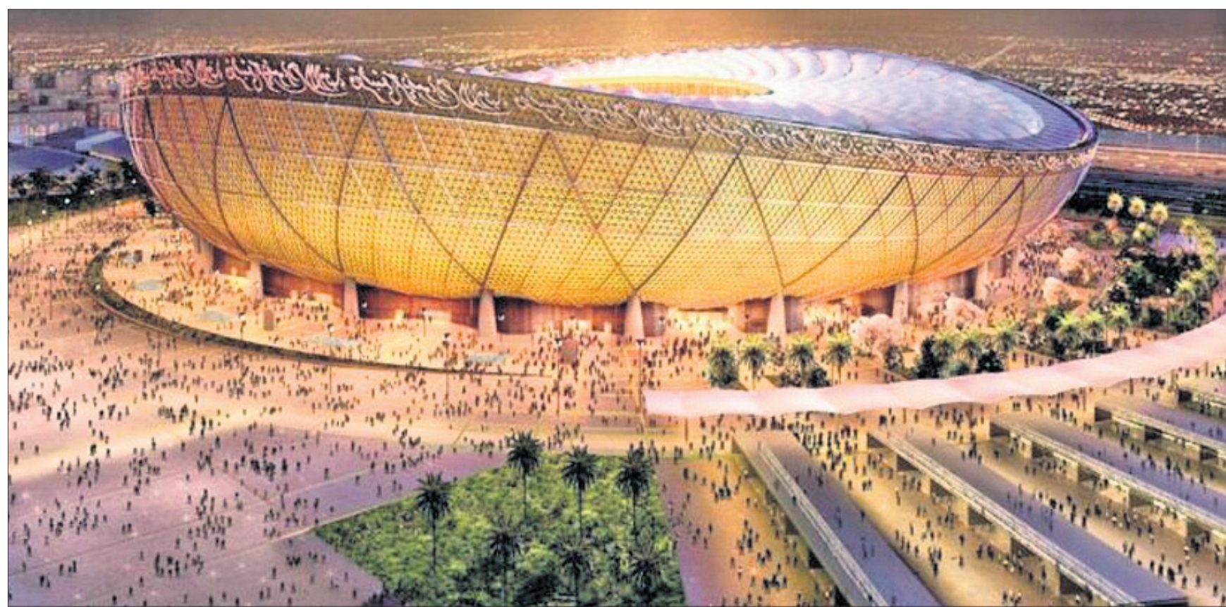
କାତାରର ସର୍ବାଧିକ ୮୦,୦୦୦ ଦର୍ଶକ ସମତା ବିଶିଷ୍ଟ ଲୁସେଲ ଆଇକନିକ୍ ସ୍ଥାଡିୟମ।