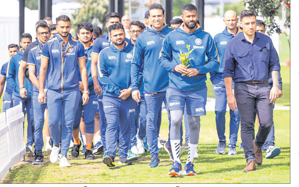
ନ୍ୟୁଜିଲାଣ୍ଡର ମାଉଣ୍ଡ ମଙ୍ଗାଗୁଲରେ ଭାରତୀୟ କ୍ରିକେଟ ଦଳ।