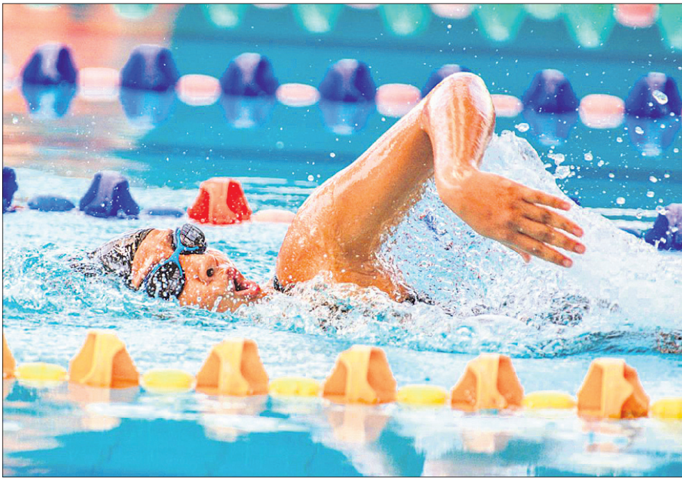
ପ୍ରଥମ ଦିବସରେ ପ୍ରତିଯୋଗିତା ଅବସରରେ ଜଣେ ପ୍ରତିଯୋଗିନୀ।