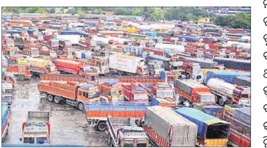
ଲାଇଫଲାଇନ୍ କର୍ମରେ ଉପକୂଳ

ରାସ୍ତାରେ ଭାରୀଯାନଗୁଡ଼ିକର ଦେଖାଇବା ପାଇଁ ଯୋଗୁଁ ଘଟୁଥିବା ସଡ଼କ ଦୁର୍ଘଟଣା ଓ ଚଳନିତ ମୁହାଁକୁ ରୋକିବା ଲାଗି ଓଡ଼ିଶା ସରକାର କାତାୟ ଏବଂ ରାଜ୍ୟ ରାଜପଥ ପାର୍ଶ୍ୱରେ ଟ୍ରକ୍ ଚର୍ମିନାଲ ନିର୍ମାଣ କରିବାକୁ ଯାଉଛନ୍ତି।