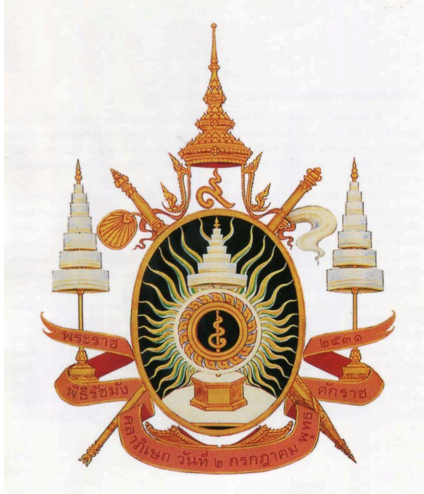
ผู้ออกแบบ นายสุนทร วิไล สำนักช่างสิบหมู่ กรมศิลปากร

เมื่อวันที่ ๒ กรกฎาคม ๒๕๓๑ นับเป็นมหามงคลสมัยของเหล่าปวงชนชาวไทยและประเทศไทย