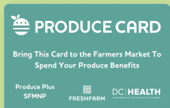
老年人农贸市场营养计划 (SFMNP)