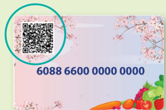
妇女、婴儿和儿童农贸市场营养计划 (WIC FMNP)