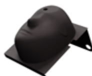
面罩仪陈列架 放置、保护您的面罩仪。