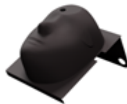
面罩仪陈列架 放置、保护您的面罩仪。