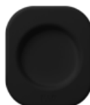
専用ス タンド FAQ™デバイスを 保護し、立てかけ に便利