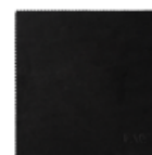
TOALLITA DE LIMPIEZA

Protege el dispositivo para que puedas llevarlo siempre contigo.