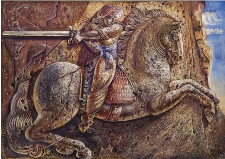
4. Դավթի կռիվը Մարա Մելիքի հետ, 1939