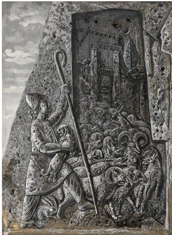
3. Դավիթը գառնարած, 1939