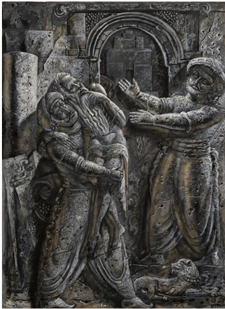
1. Բերրի անվանադրուհը, 1939 .