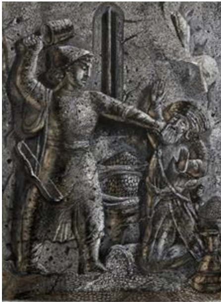
5. Դավիթը և հարկահավաքը, 1939