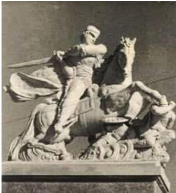
11.Մասունցի Դավթի գիպսե ձիարձանը, 1939