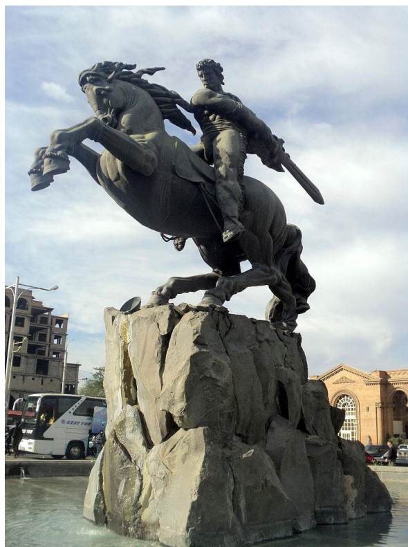
12.Մասունցի Դավթի պղնձե ձիարձանը, 1959