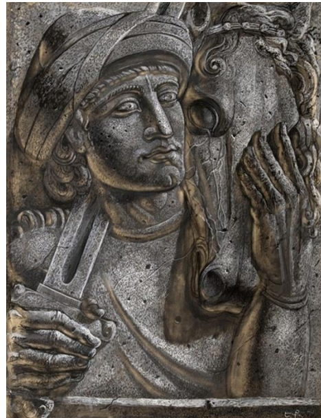
6. Դավիթը և Քուռկիկ Ջալալին, 1939