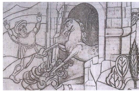
9. Դավթի և Քուռկիկ Ջալալու հանդիպումը, 1969