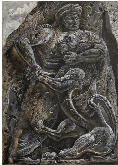
2. Աղյուծաձև Միերը, 1939