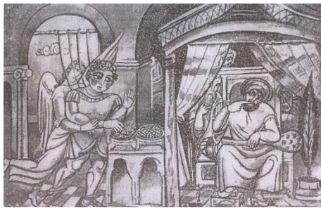
8. Մարա Մելիքը փորձում է Դավթին ոսկով և կրակով, 1969