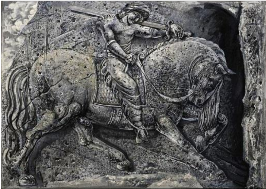
7. Փոքր Մհերը, 1939