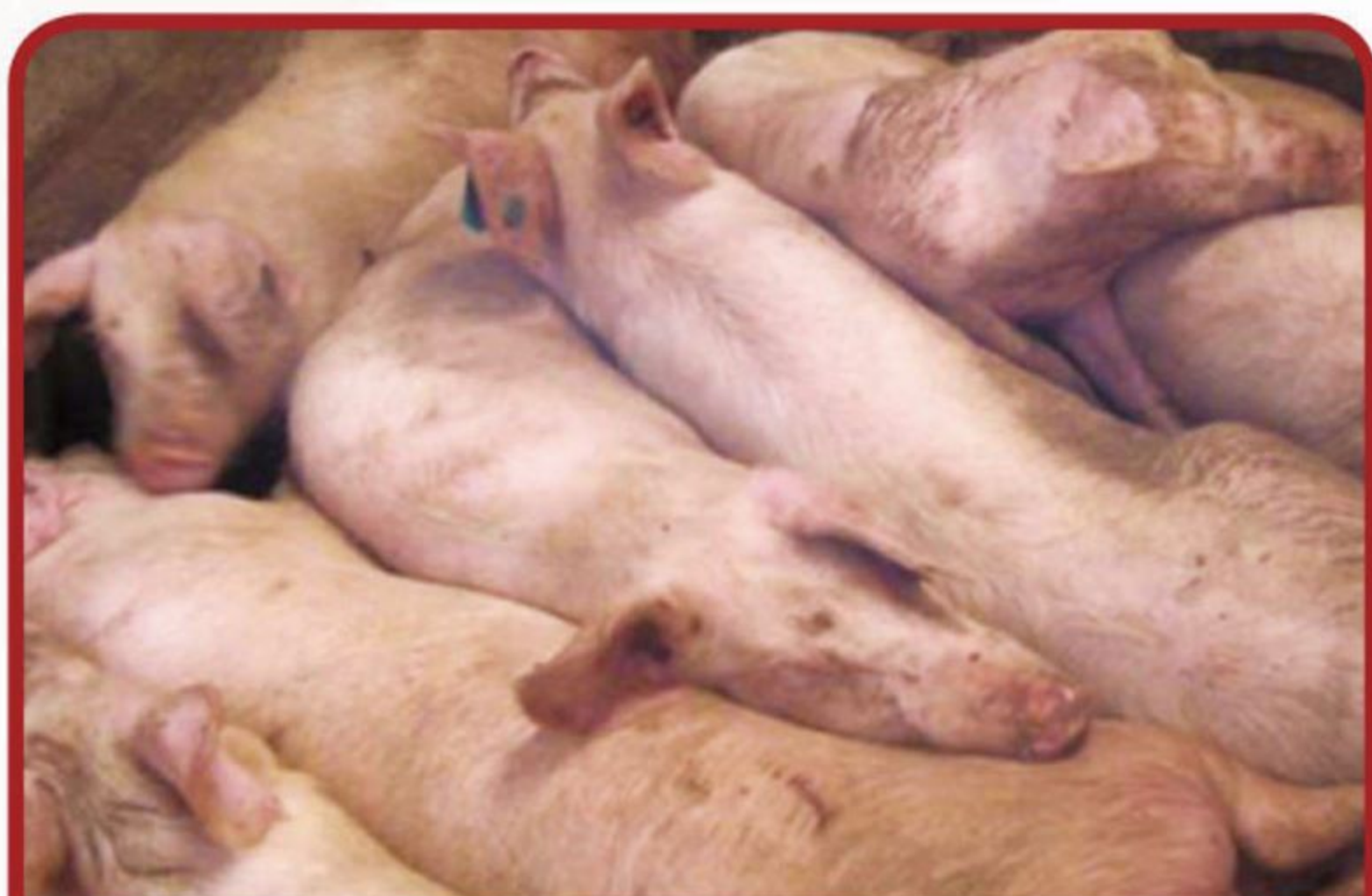
돼지들이 한데 겹쳐있음