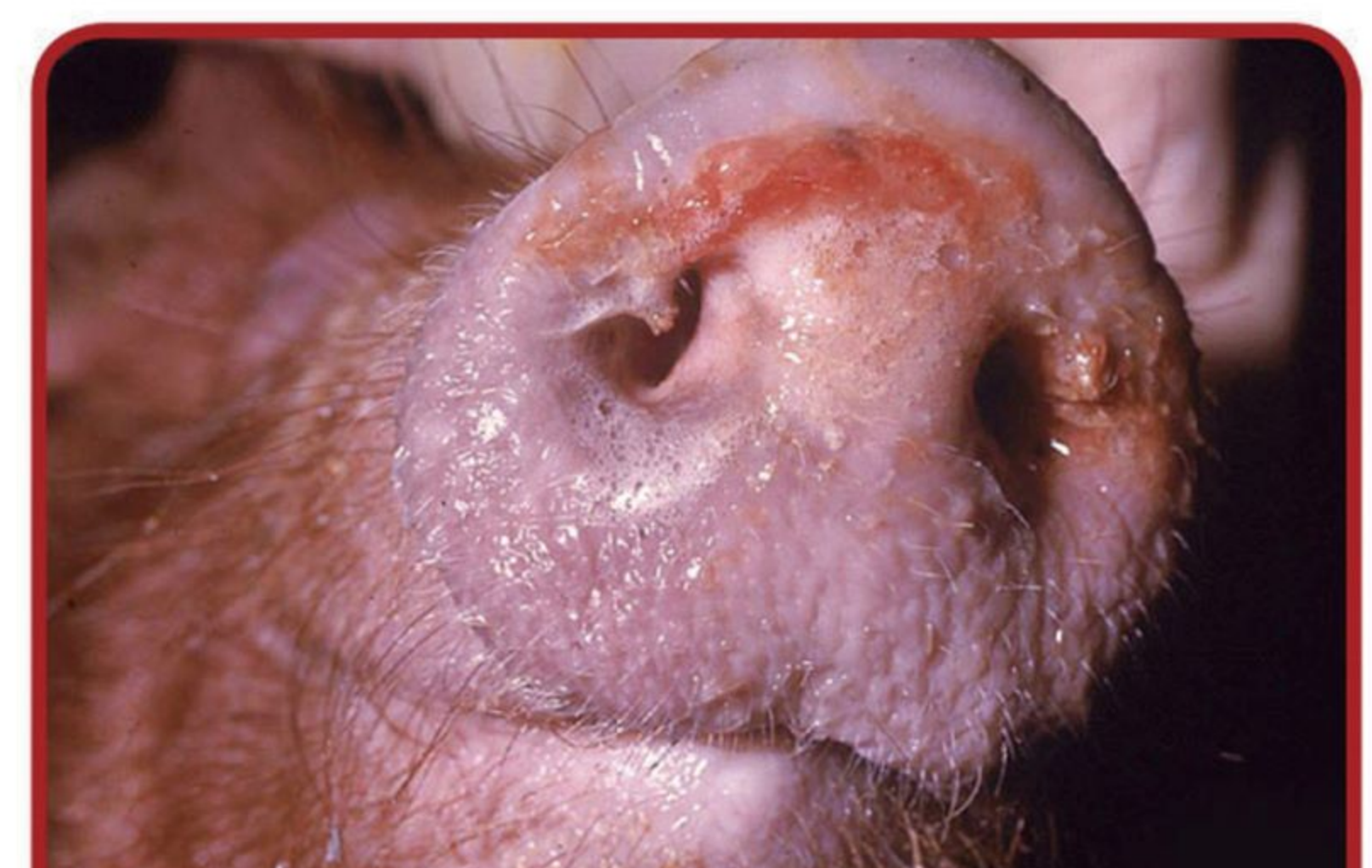
혈액성 점액성 거품이 있는 비강(코)의 분비물

본 원고에 게재된 사진은 원저자의 허락을 얻고 게재하는 것이므로 사전동의 없이 사진을 무단 사용 할 수 없습니다.