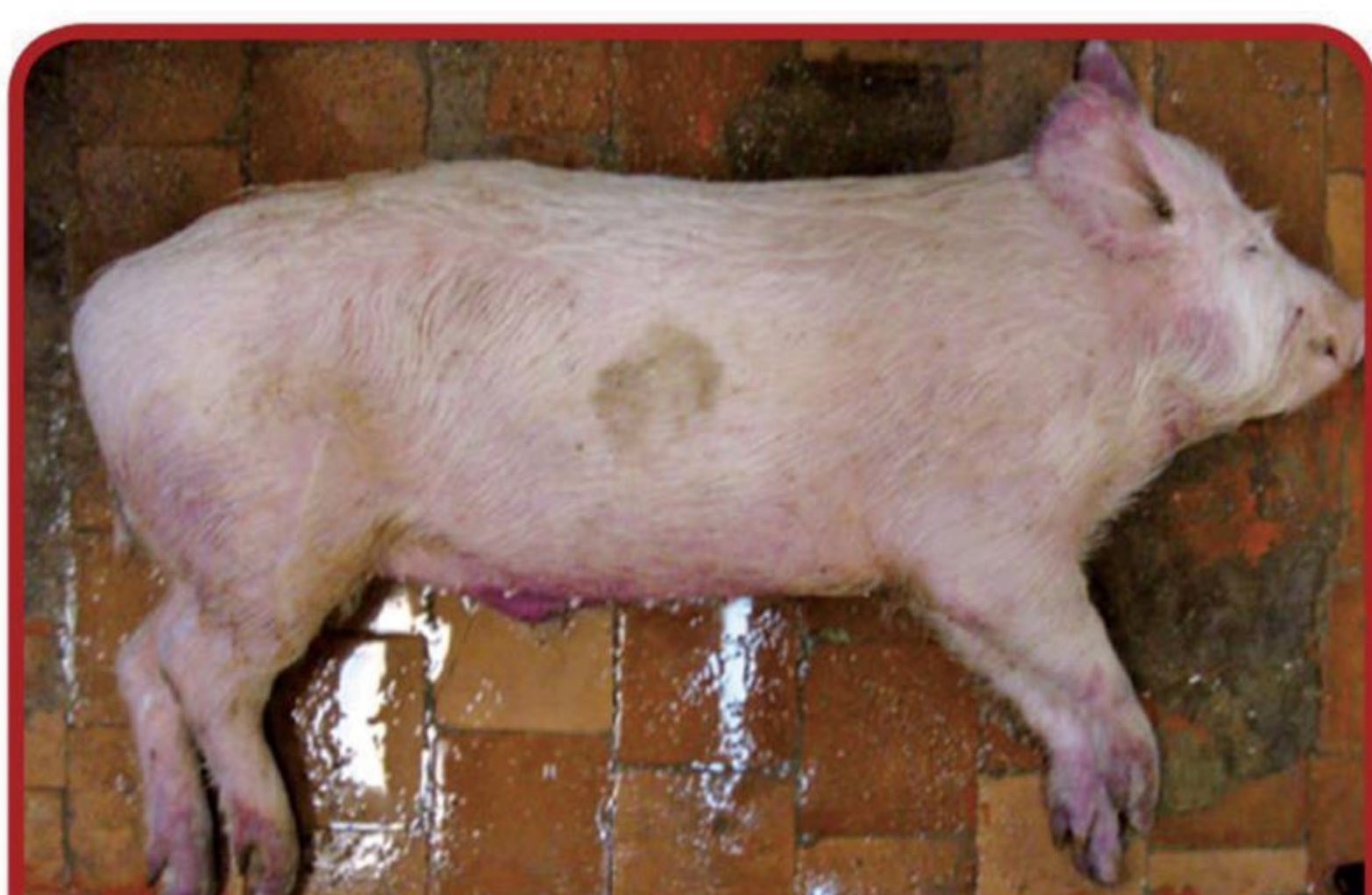
사지말단부 및 복부의 염증 및 충혈