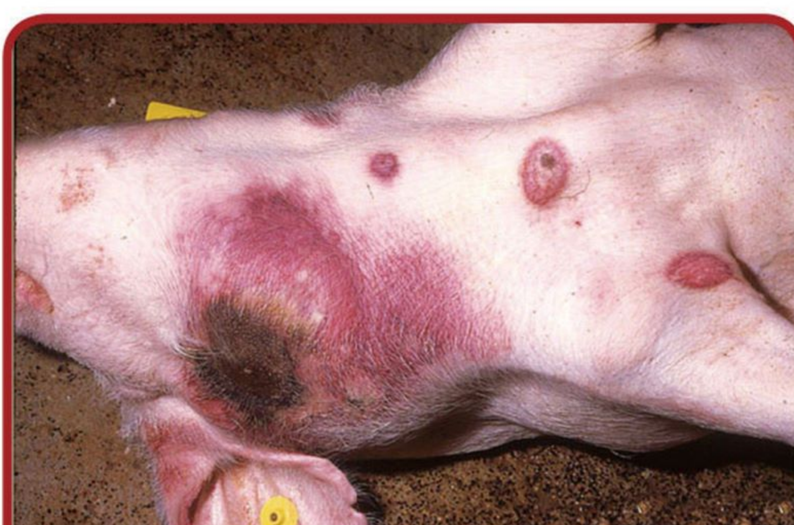
피부 충혈·출혈 및 괴사소견