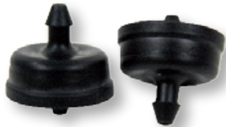
PC Button Pressure Compensation